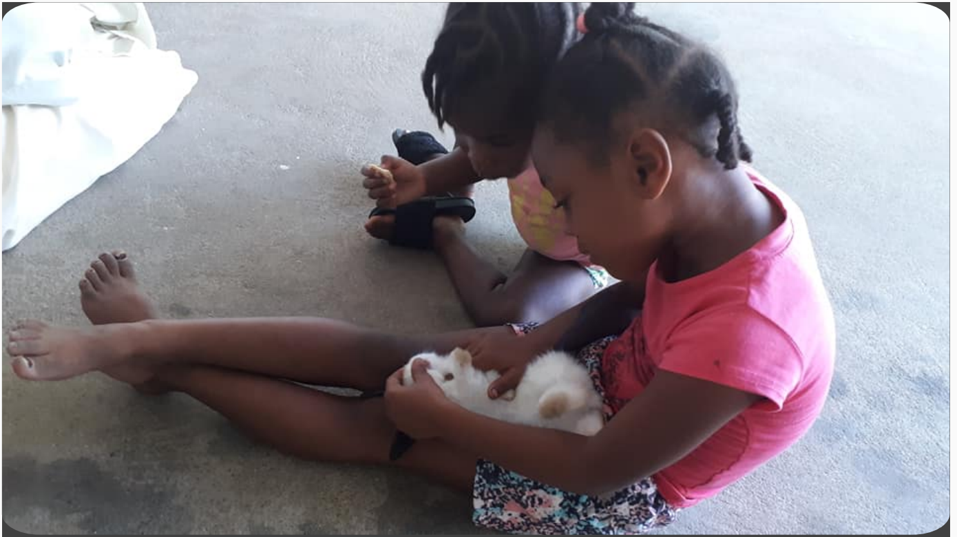
Child & Animal Therapy day